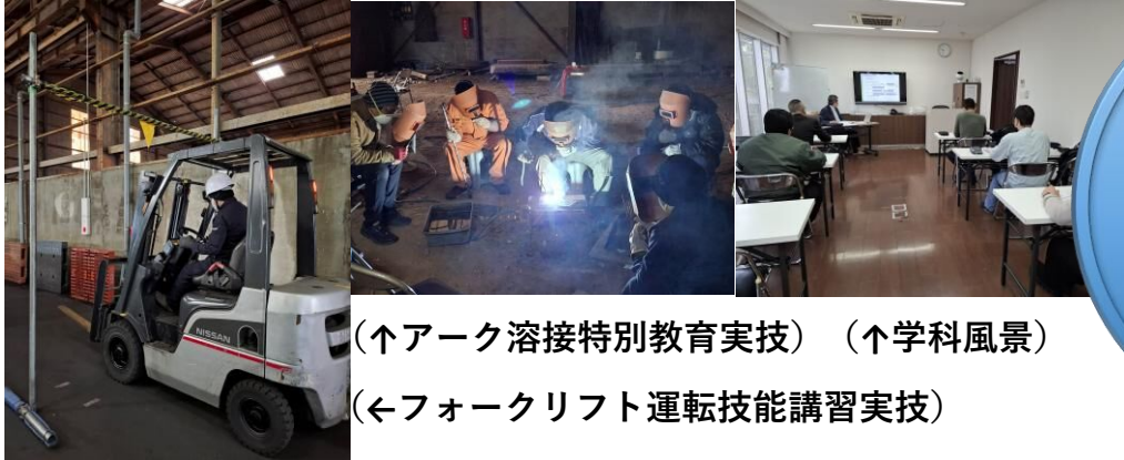
(↑アーク溶接特別教育実技) (↑学科風景)