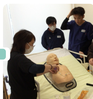
デジタル機器を活用した 多彩な授業