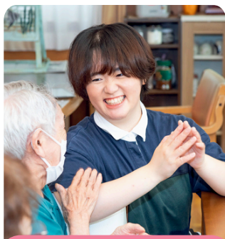
スポーツレクリエーションコース