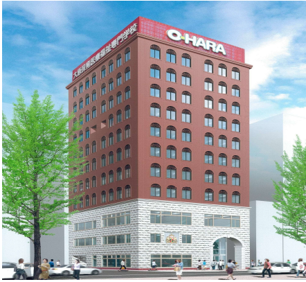
福岡保育こども医療福祉専門学校

〒812-0026 福岡市博多区上川端町13-19 ★地下鉄 中洲川端駅 7番出口 徒歩 1分 TEL : 092-271-2286 ★西鉄バス 川端町・博多座前 徒歩 1分 URL : https://www.o-hara.ac.jp/senmon/school/fukuoka_iryu